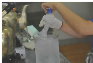
室内実験の実習の様子

今年は、例年より1か月遅れでの開催となり、川や山でのお天気を心配していたのですが、2日間を通して天候に恵まれ、予定通りすべての実習を行うことができ、スタッフ一同ほっといたしました。来年度以降も、同様の実習を実施する予定ですので、興味をもたれた方は是非ご参加ください。