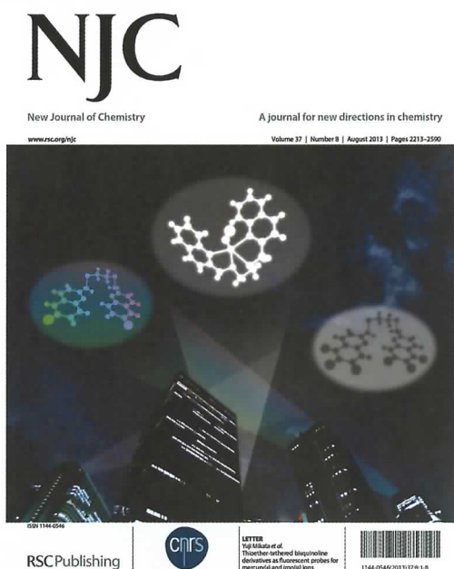
図1 論文掲載号の表紙

元素の周期表をご覧くださいと、「亜鉛(Zn)」と「水銀(Hg)」は同じ族(縦の列)に属しており、その二つの元素の間に「カドミウム(Cd)」が存在しています。同じ族に属する元素は互いに性質がよく似ているため、これらを明確に区別して特異的に検出できる化合物の例はそれほど多くありません。そこで、次はカドミウムイオンを特異的に蛍光検出できる化合物を作ろうと計画しました。化合物の設計におけるヒントは既に得られており、上に述べた亜鉛イオン蛍光センサーの鍵化合物であるTQENは、カドミウムイオン存在下で亜鉛イオン存在時の60%程度の蛍