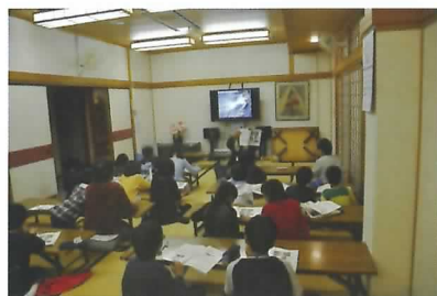
室内実習の様子(虫の観察)