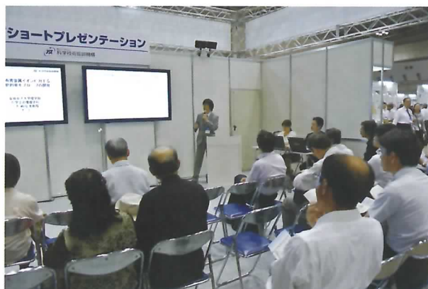
ショートプレゼンテーションの様子