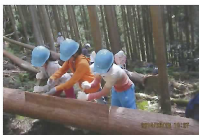
山の実習の様子(皮はぎ体験)